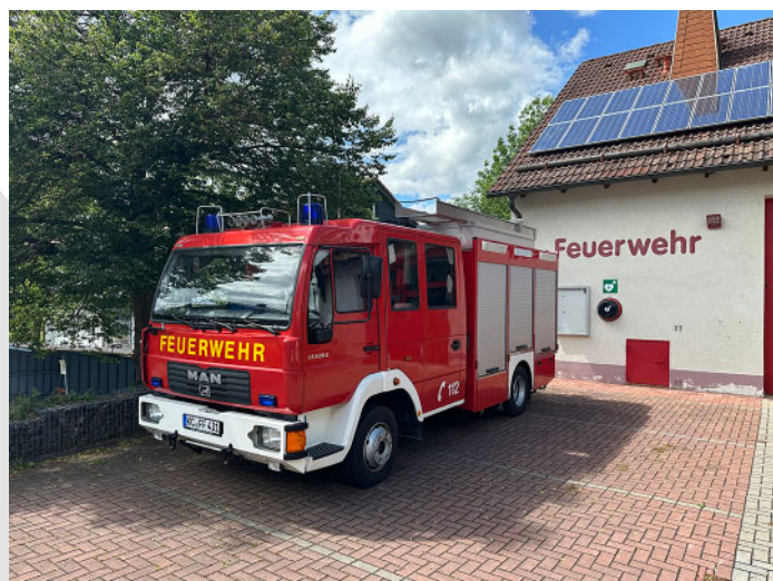
Das „neue alte“ LF 8/6 nach der Abholung wartet noch auf kleinere Umbauten sowie die neue Beklebung.