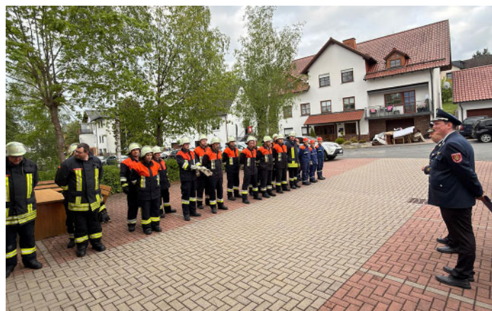
Die Feuerwehr Schneckelohe ist zur Besichtigung durch die Kreisbrandinspektion angetreten.

Vor Ort nutzten viele Interessierte die Gelegenheit, das Fahrzeug ausgiebig zu besichtigen. Bis zur endgültigen Indienststellung sind noch einige Arbeiten notwendig, unter anderem müssen Funkgeräte eingebaut und kleinere Umbauten vorgenommen werden. Außerdem muss die Mannschaft das neue Fahrzeug kennenlernen und damit üben. Danach soll das Fahrzeug offiziell in den Einsatzdienst übernommen werden. Mit der erfolgreichen Besichtigung und dem neuen Einsatzfahrzeug blickt die FF Schneckelohe optimistisch in die Zukunft. Und sie freut sich auf ihr 100jähriges Jubiläum, dass sie vom 19. bis 21.6.2026 mit einem großen Festprogramm feiern wird.