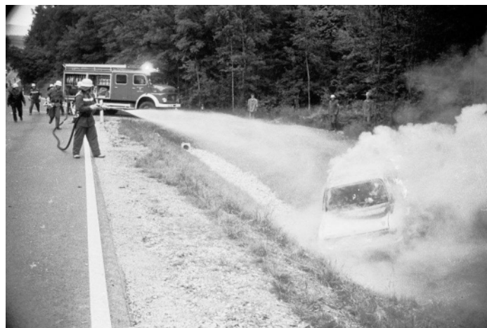
PKW-Brand in den 80er Jahren

Über Jahrzehnte hinweg leistete das Tanklöschfahrzeug bei zahlreichen Einsätzen treue und zuverlässige Dienste. Zu den prägendsten Einsätzen zählen unter anderem die Explosion bei der Firma Rüger Druck, die Brände der Sägewerke Schilling und Habelitz, der Brand bei der Firma Thiele, große Scheunenbrände in Schwärzdorf und Neundorf sowie der Großbrand des Möbelhauses Mäusbacher.