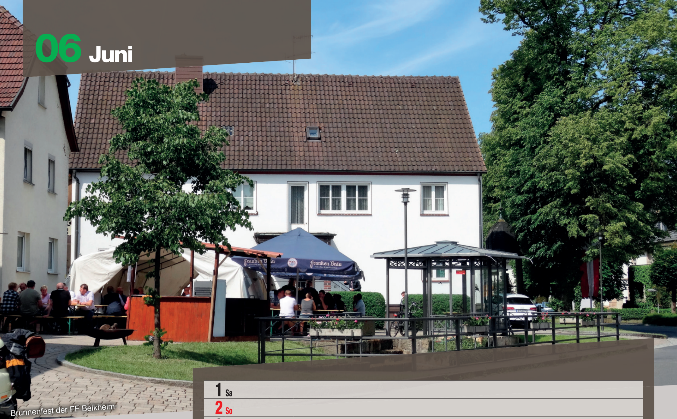
Brunnenfest der FF Beikheim