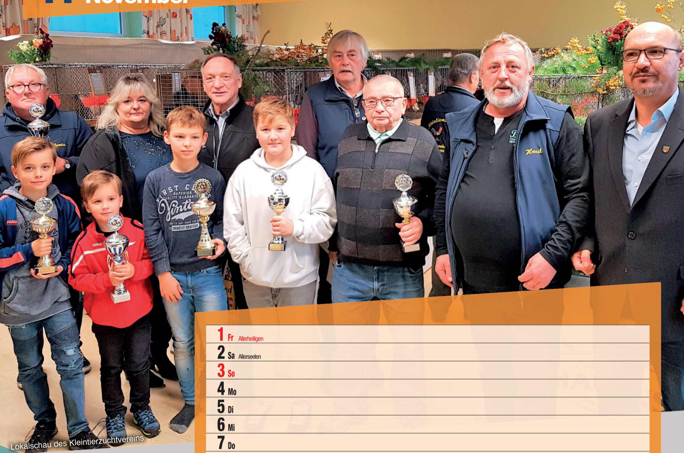
Lokalschau des Kleintierzuchtvereins