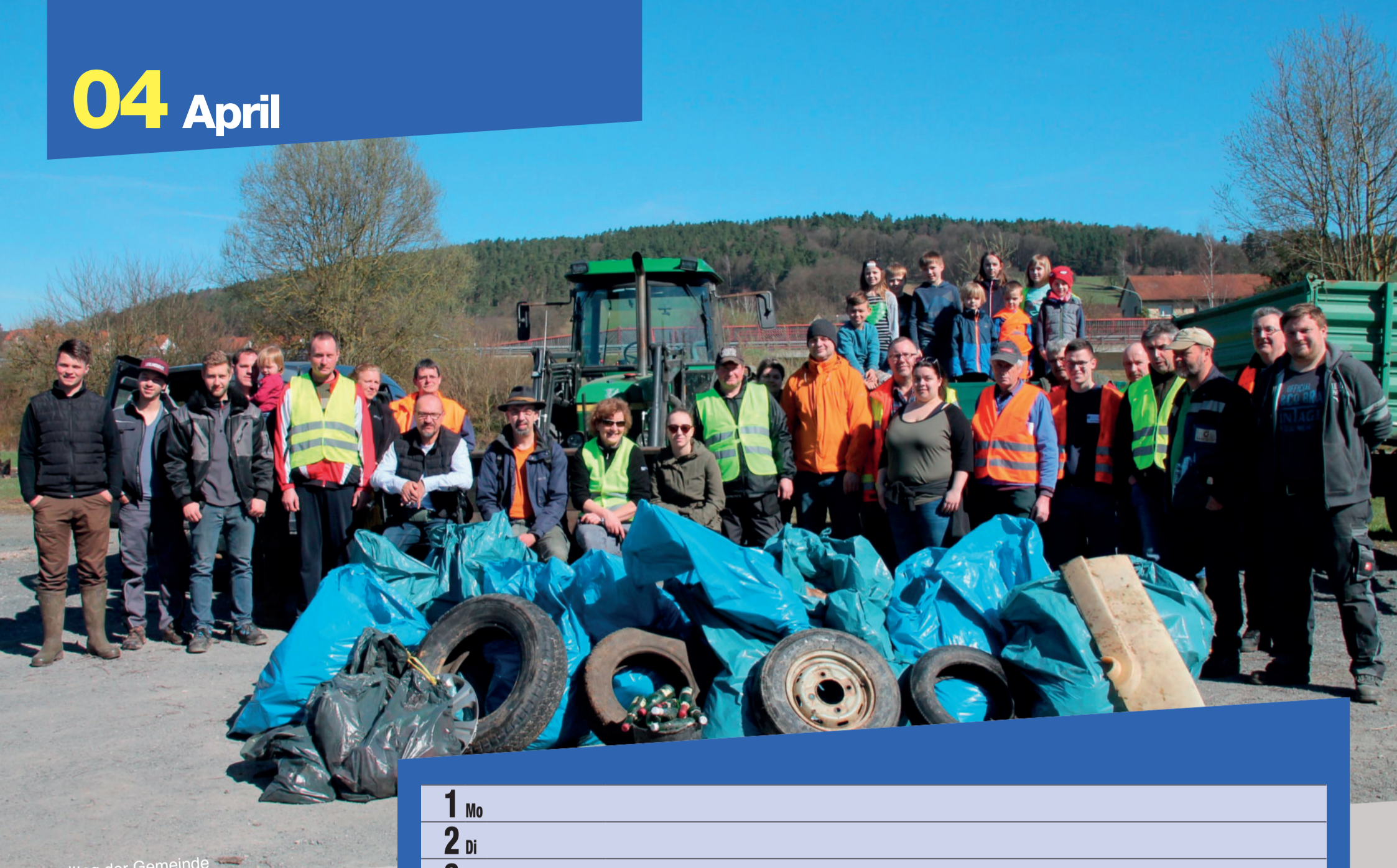
Umwelttag der Gemeinde