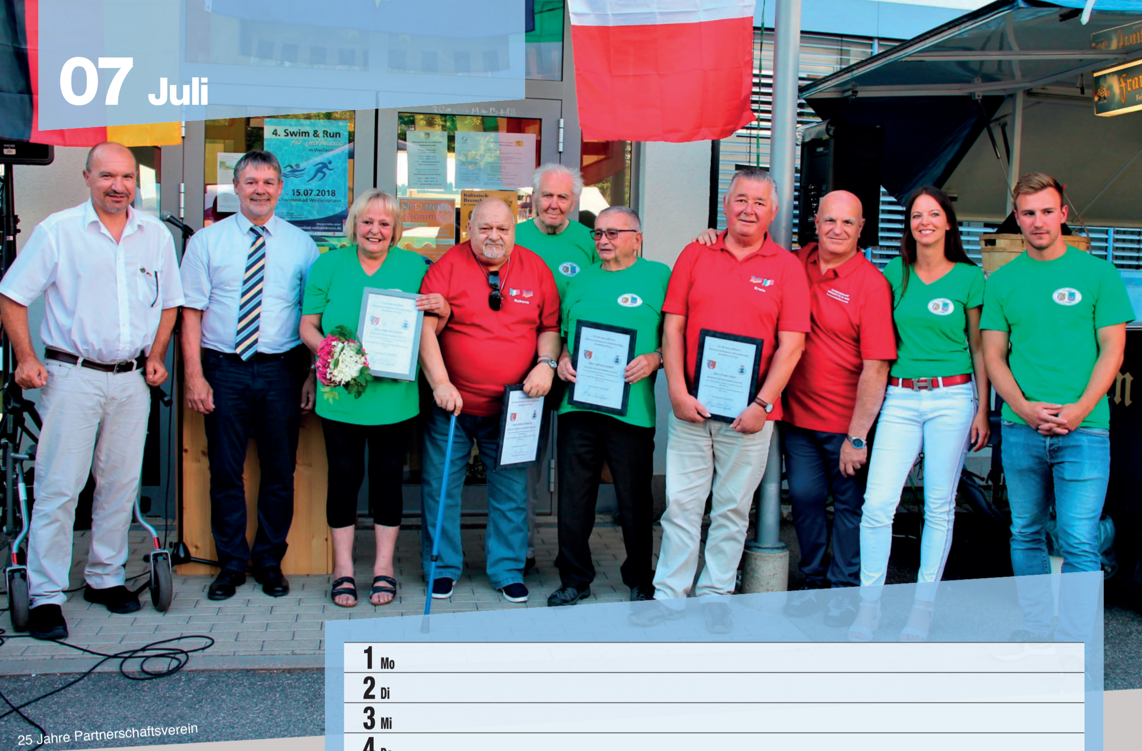
25 Jahre Partnerschaftsverein