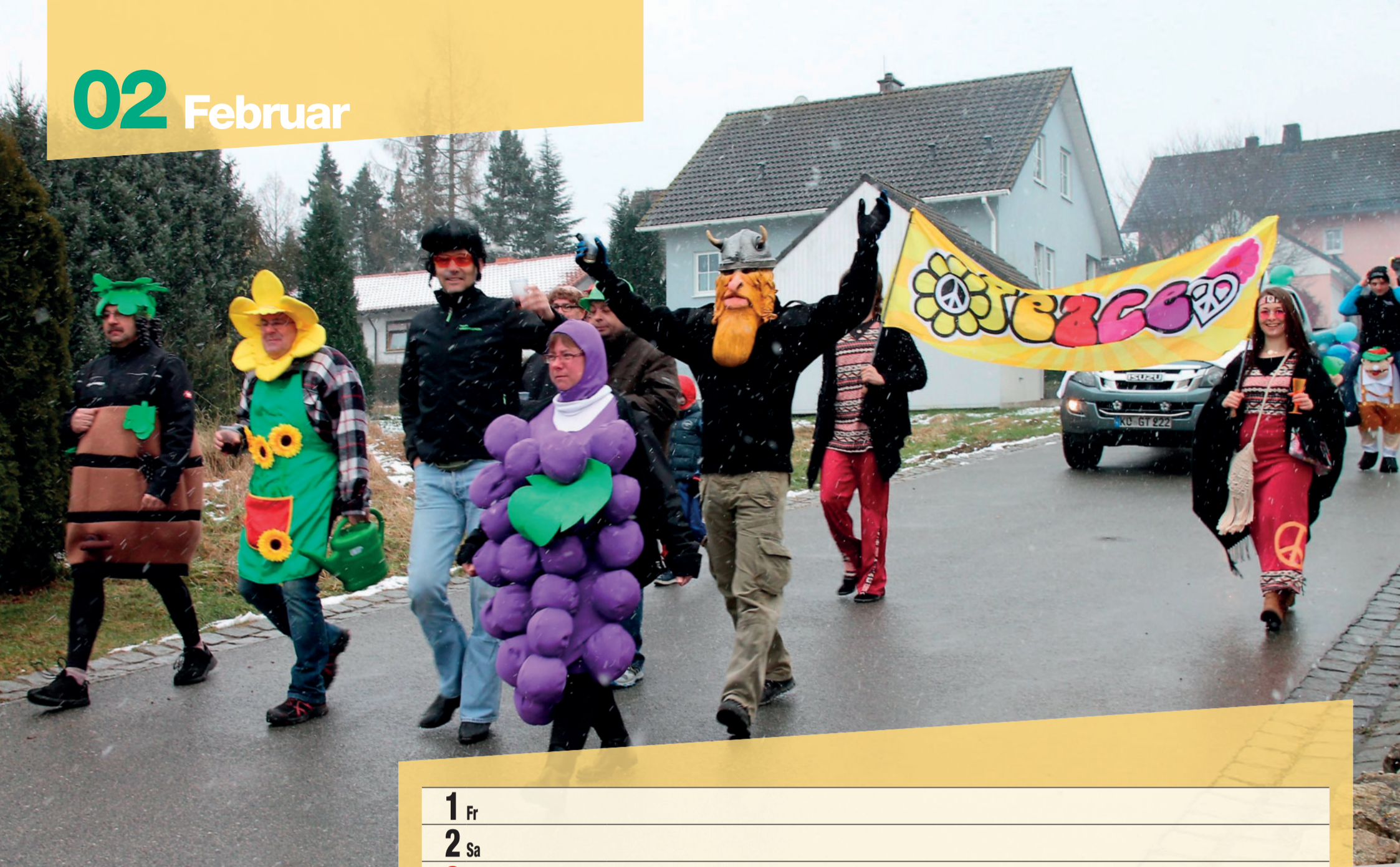
Gaudiwurm des RSV Schneckenlohe