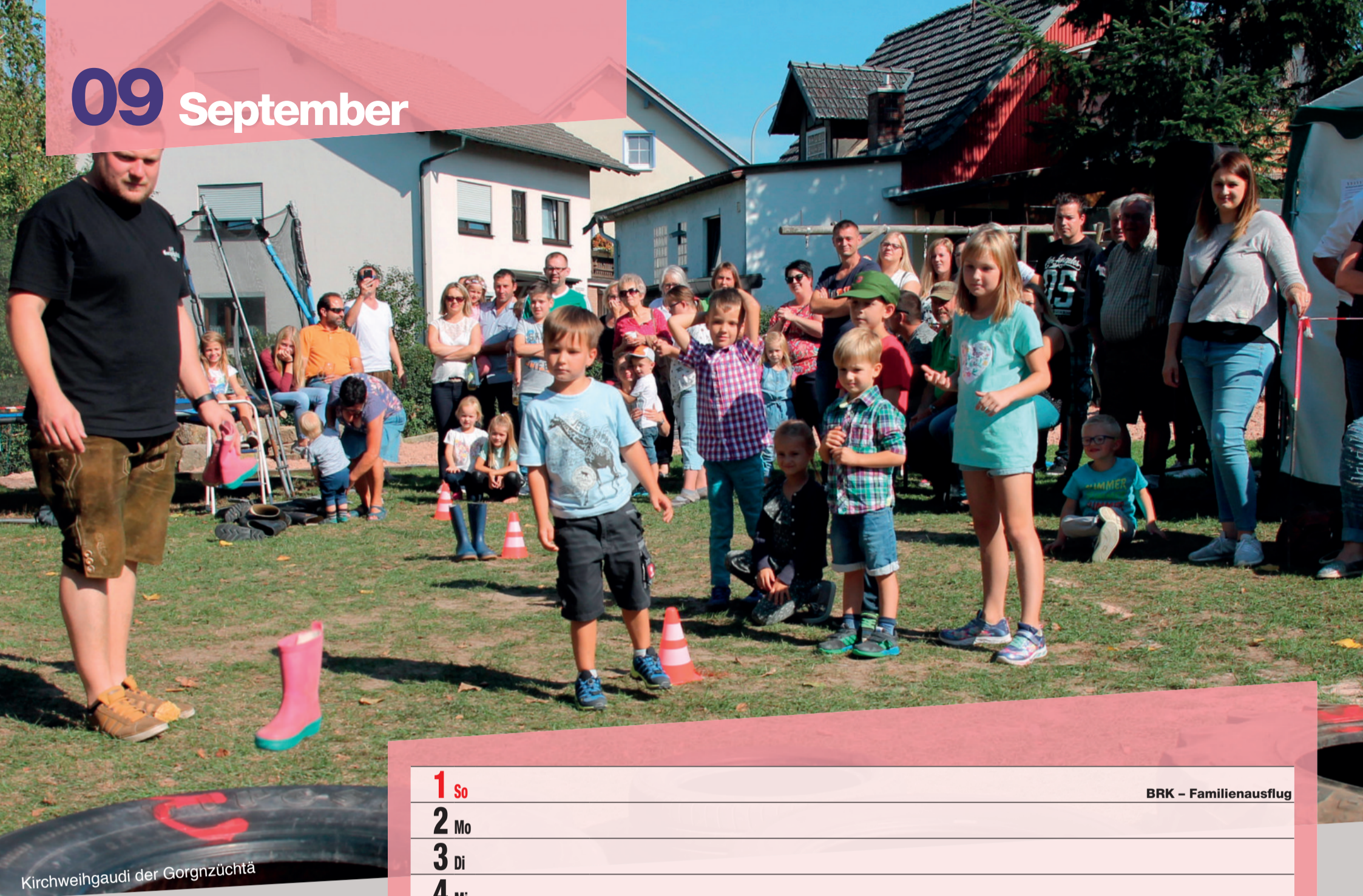
Kirchweihgaudi der Gorgnzüchtä