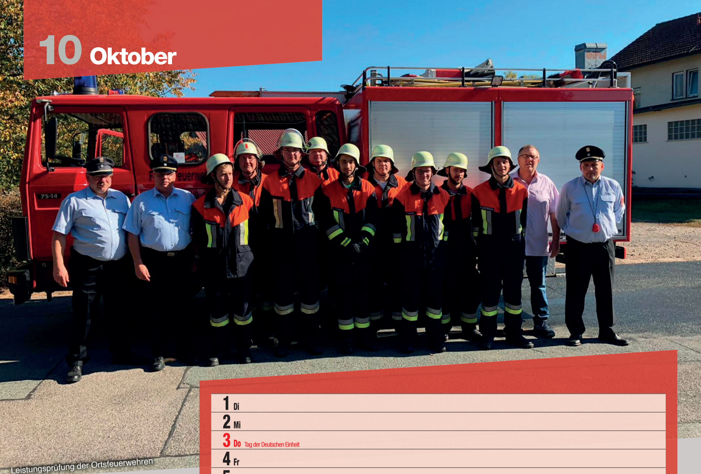
Leistungsprüfung der Ortsfeuerwehren