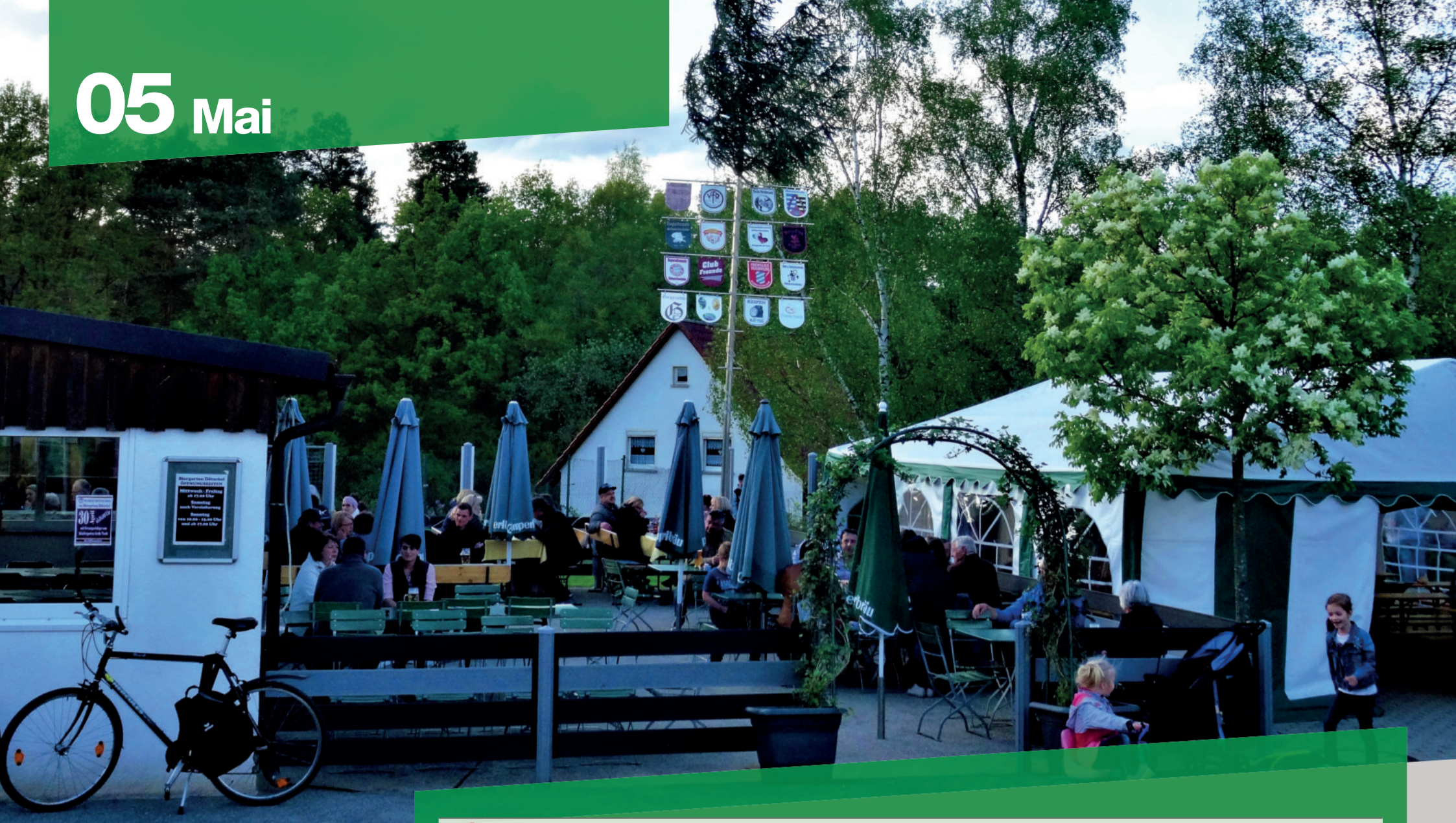
Maifeier des VfR