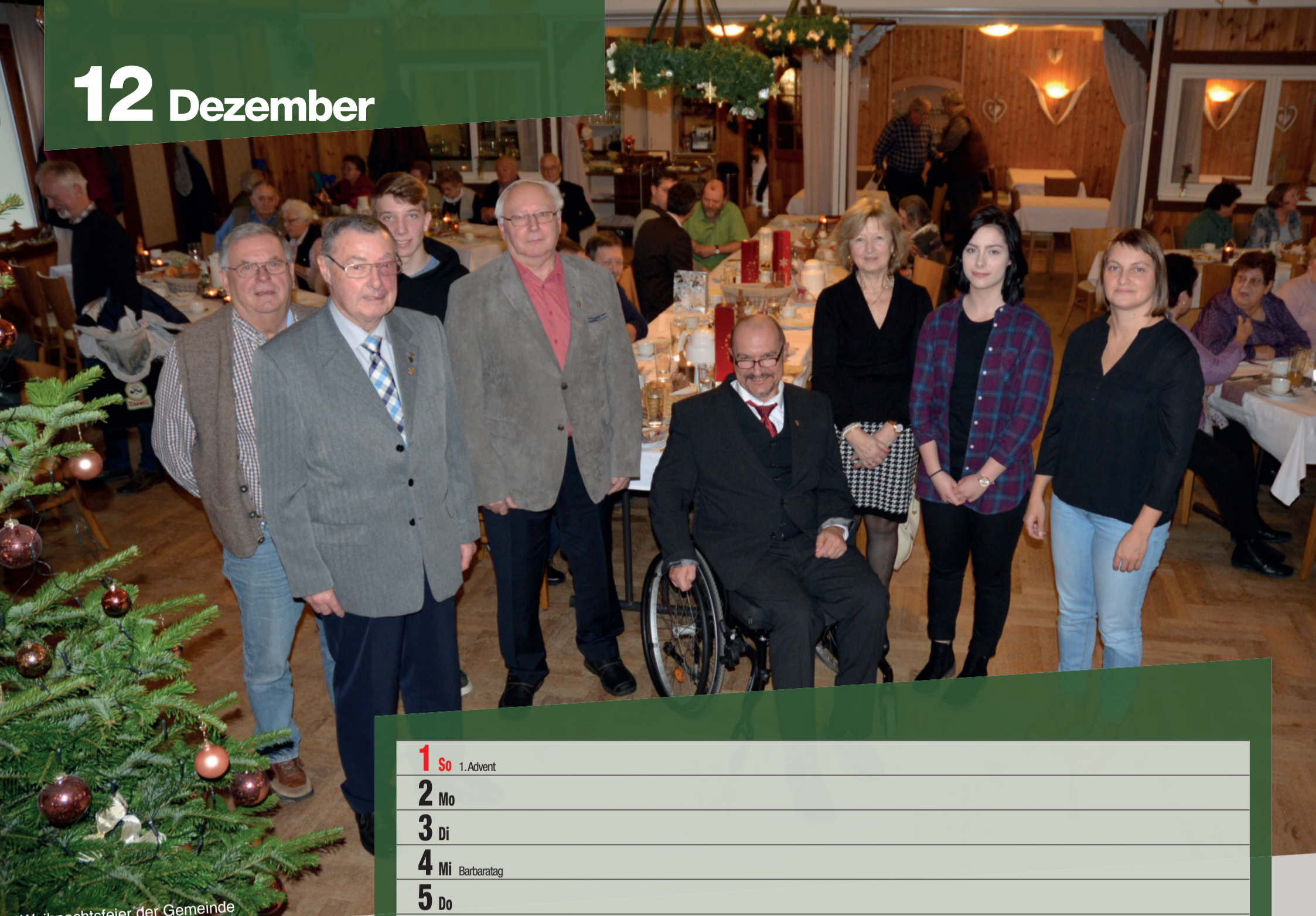
Weihnachtsfeier der Gemeinde