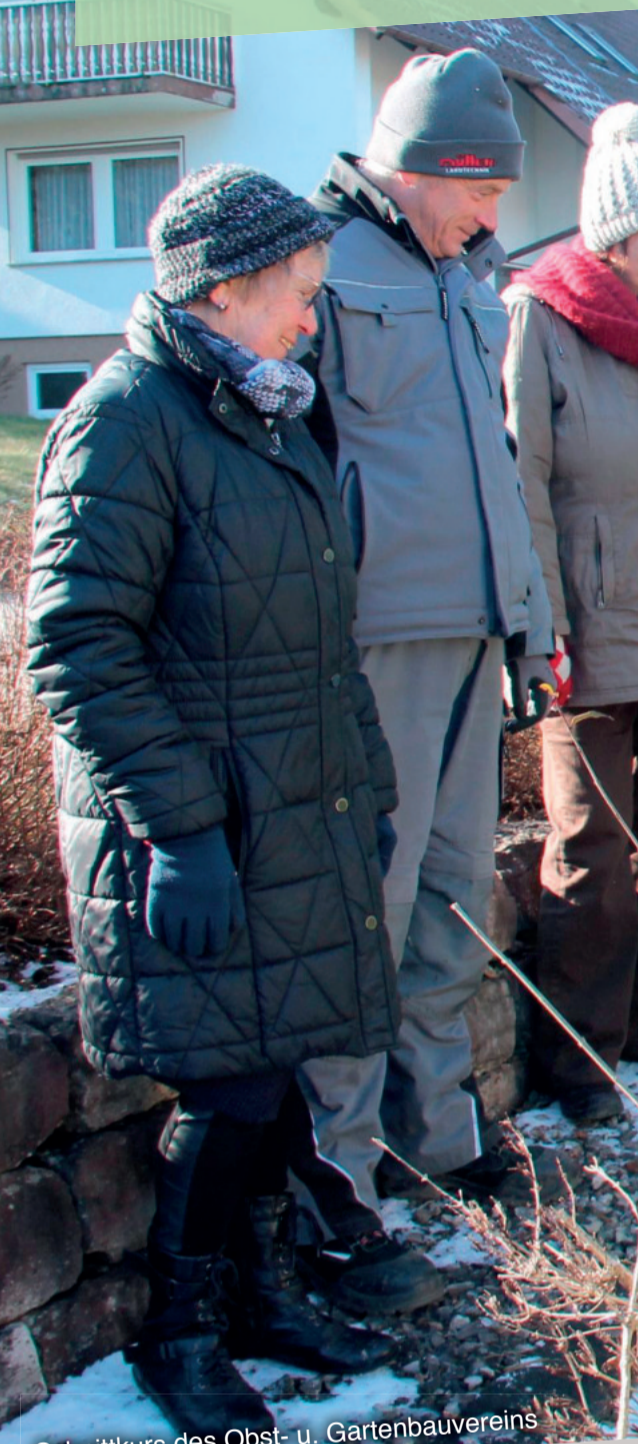
Schnittkurs des Obst- u. Gartenbauvereins